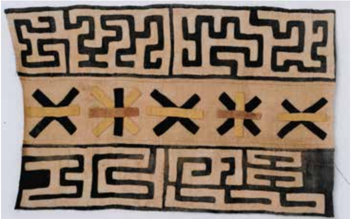
Bakuba/Kongo, Applikation auf Raphiagewebe 59 x 59 cm