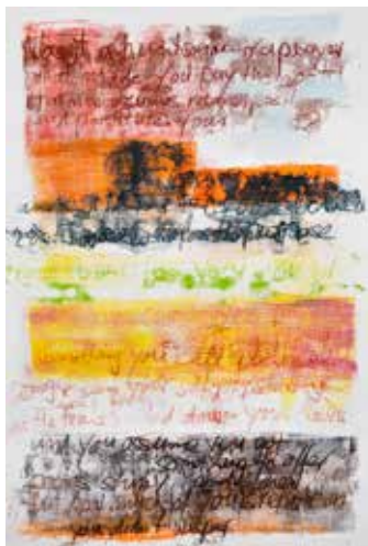
»crucify your mind 1« 2015, 154 x 106 cm Monotypie auf Papier