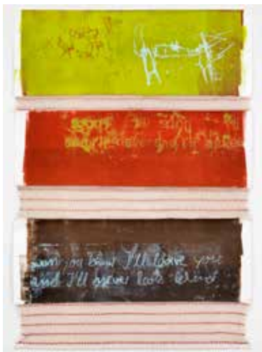
»crucify your mind 2« 2015, 154 x 106 cm Monotypie auf Papier und Stoff